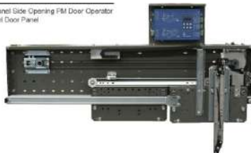
Panel Side Opening FM Door Operator w/ Door Panel

CON APERTURA DE 900 MM DE DERECHA A IZQUIERDA CON MOTOR INCLUIDO