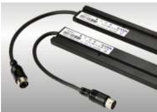
CORTINA DE LUZ WECO SFT 620

CORTINA DE LUZ WECO SFT 620. JUEGO 2 PIEZAS)