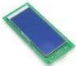
DISPLAY AZUL PARA PASILLO- HCB-SL-V FOR LOP

DISPLAY AZUL PARA PASILLO- HCB-SL FOR LOP