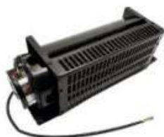
VENTILADOR PARA ELEVADOR FB-9B

DISPLAY AZUL PARA CABINA- HCB-SL FOR LOP