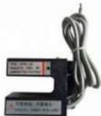
LEVELING SENSOR YG-30B MAGNETIC PROXIMITY SWITCH