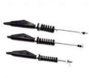
TENSOR CABLES CALIBRE 8MM