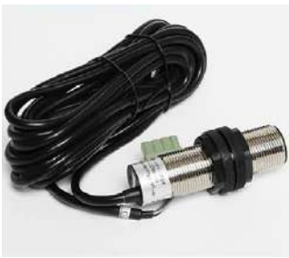
SENSOR DE SOBREPESO EMK-HDJD