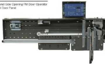
Panel Side Opening FM Door Operator w/ Door Panel