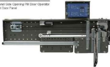
Panel Side Opening FM Door Operator w/ Door Panel

CON APERTURA DE 800 MM DE DERECHA A IZQUIERDA CON MOTOR INCLUIDO