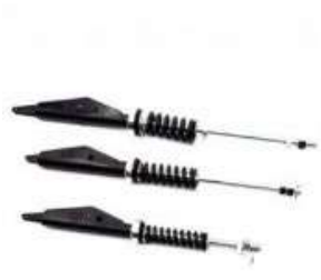
TENSOR CABLES CALIBRE 10MM