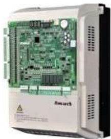
CONTROLADOR MONARCH 220-NICE-LC-4030