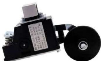
LIMIT SWITCH HD1370-J