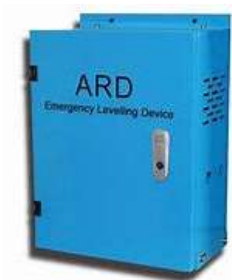
ELEVATOR ARD HH-ARD-3P150-2

CORTINA DE LUZ WECO SFT 620. JUEGO 2 PIEZAS)