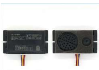
INTERCOM FOR ELEVATOR NKT12

ELEVATOR ARD ( AUTOMATIC RESCUE DEVICE) HH-ARD-3P150-2. INC BATERIAS